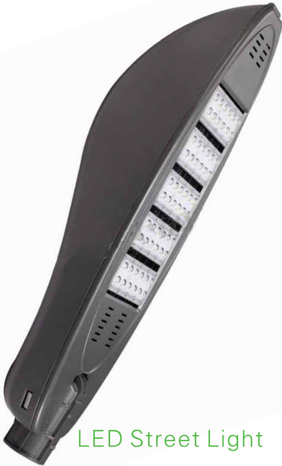
LED Street Light

Orgullosos de su alta potencia LED en luminarias urbanas ONE 4 ALL presenta esta nueva serie de productos de ahorro de energía a base de LEDs de alta potencia como fuente de iluminación que supera a la iluminación tradicional.